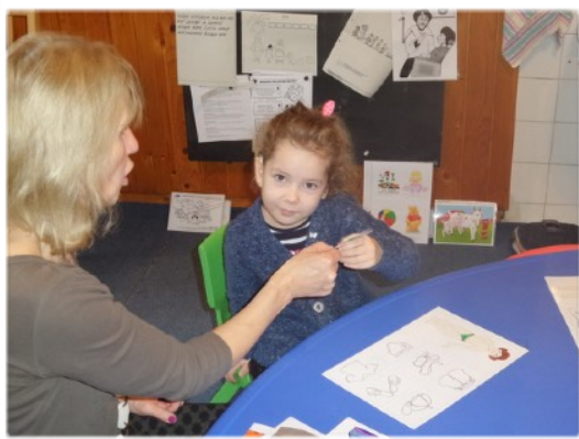
na hodine logopédie