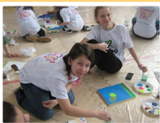
Deň dobrých skutkov