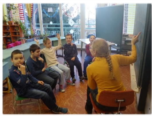
hodina slovenského jazyka