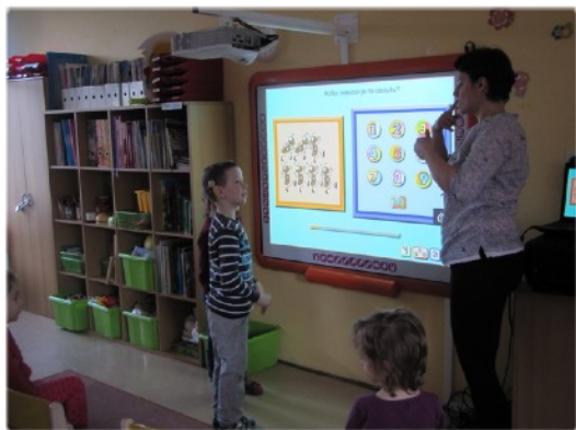
IKT v triede Motýľov

Centrum špeciálno-pedagogického poradenstva