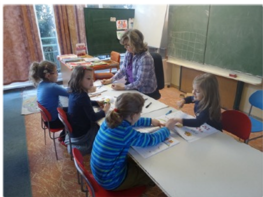
učíme sa čítať